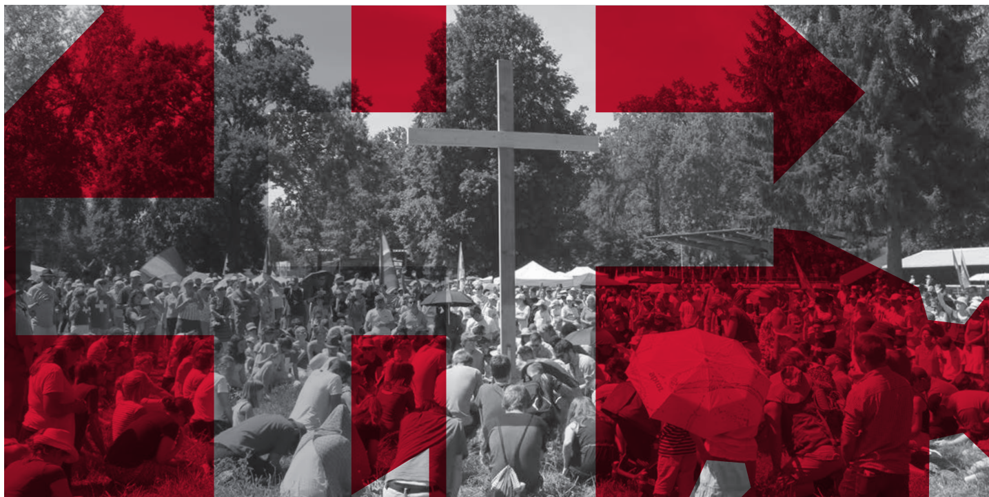
Les jeunes rassemblés autour de la Croix