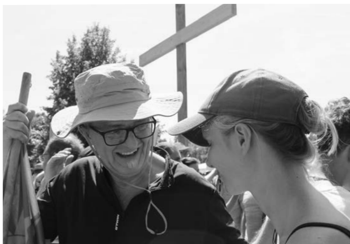
Jeunes et vieux autour de la Croix.